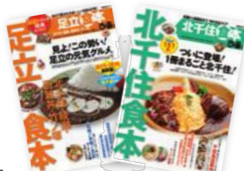
「足立食本」「北千住食本」 (共にびあ発行)

最近若い女性にも人気の“おやし飲み”。北千住駅西口を出ると、“飲み横”の愛称で有名な飲み屋街に、気取らない笑い声が響きます。スイーツが大好きな人には、「蔵」を活用したノスタルジックな喫茶店で、優しい味のワッフルと香り立つコーヒーを。ほかにもコスパ自慢のお惣菜屋や定食屋など、ディープな足立グルメを食べ歩こう！