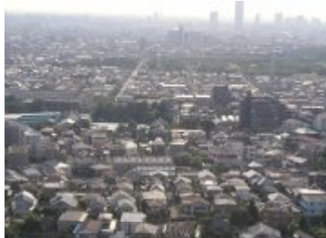
竹の塚エミエルタワーから 舎人公園方面を望む

さらに北の玄関口として、竹ノ塚駅西口南地区での再開発事業が竣工し、エミエルタワーがシンボルとして建設されている。大規模工場跡地では、新田地区や西新井駅西口周辺地区での住宅・商業系開発が進み、千住大橋駅周辺地区も同様な開発を行うにあたり、計画等の整備が進んでいる。平成19年度には、区西側を縦断する日暮里・舎人ライナーが開業を予定し、その整備の進捗に合わせるように、沿線周辺地区でのマンション等の建設が顕著となってきている。