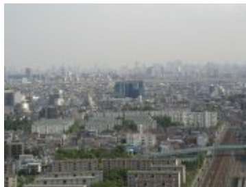
竹の塚から西新井方面を望む