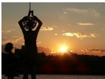
荒川河川敷から望む ダイヤモンド富士