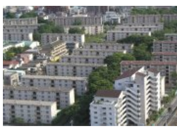
都市再生機構竹の塚第二団地