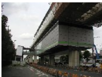
日暮里・舎人ライナー工事