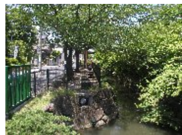
葛西用水親水水路