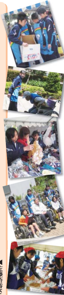
▲西新井では中学生たちがまちで様々なボランティア活動を行っています

西新井のまちでは、中学生のボランティア活動を介して、子どもたちとまちの人たちの間に互いを思う気持ちが生まれてきているのか、人々の声を聞きました。